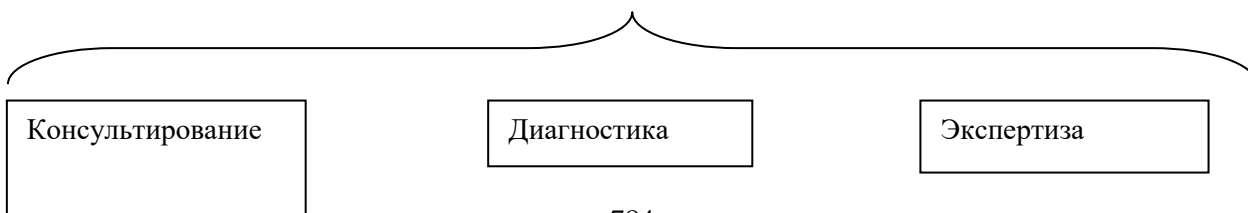
Основные формы сопровождения